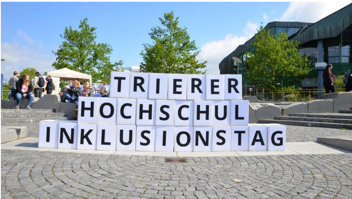
Foto: Forumsplatte der Universität Trier