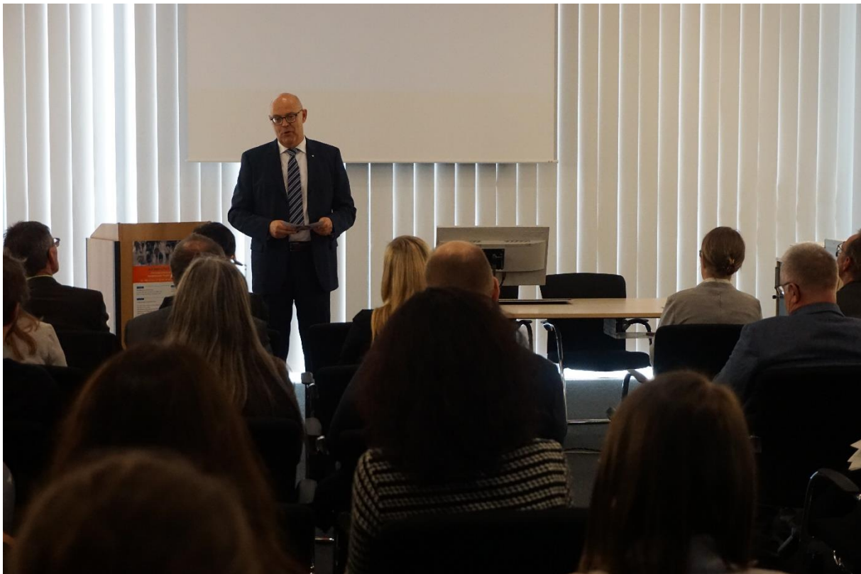
Fotos (diese und folgende Seite): Impressionen vom Wissenschaftsforum 2019 mit Markt der Möglichkeiten

Kontakt: Daniel Bauerfeld, Universität Trier / Isabell Juchem, Agentur für Arbeit Trier