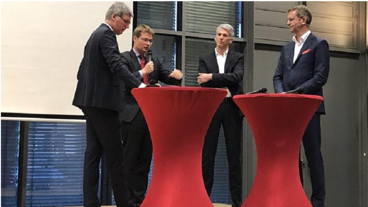
Foto: Diskussionsrunde beim IHK-Wirtschaftsforum Trier