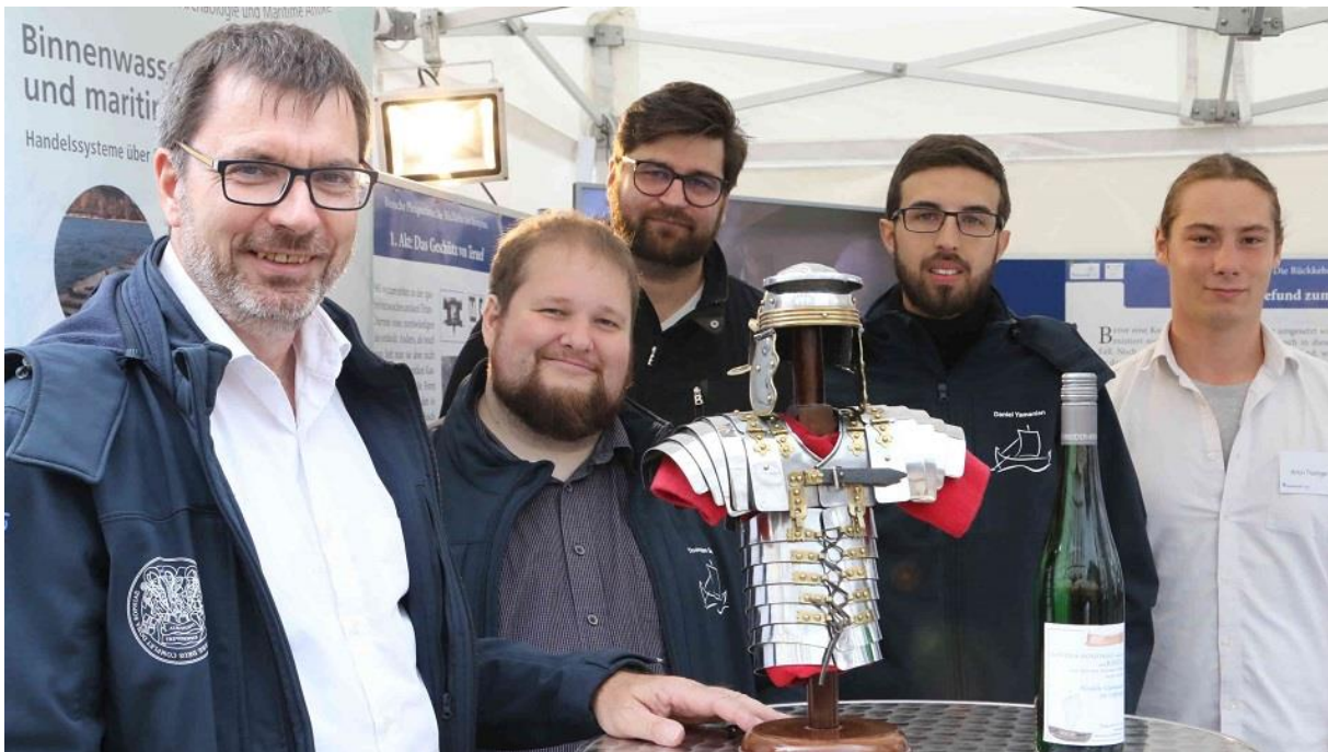
Fotos (diese und folgende Seite): Impressionen vom City Campus 2019